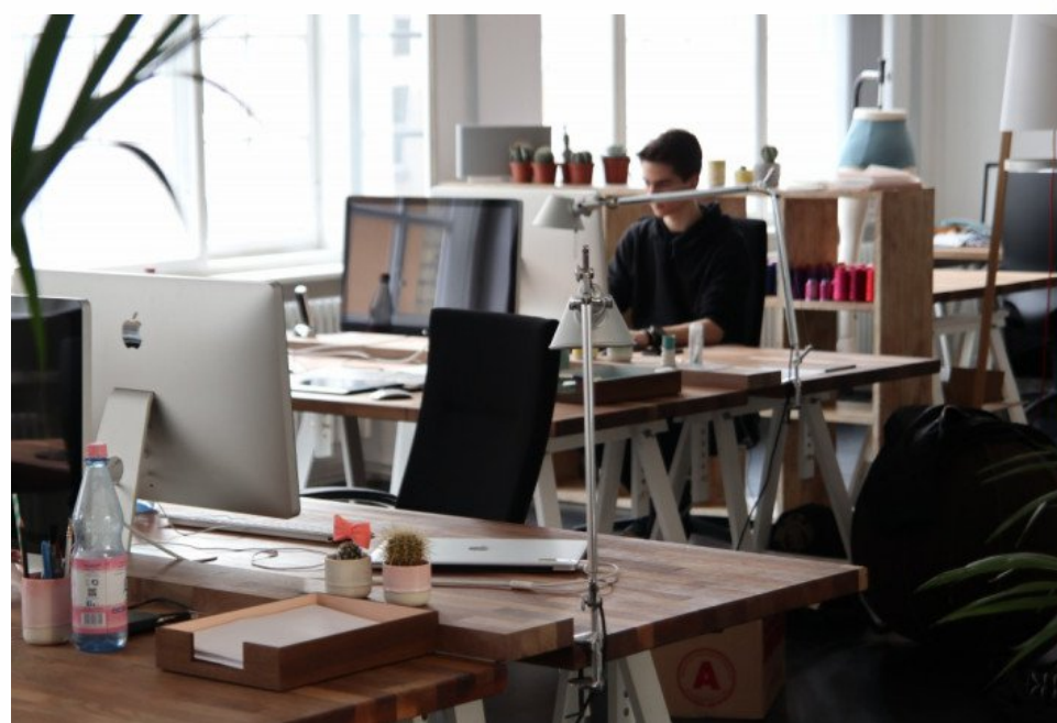
Коворкинг или офис